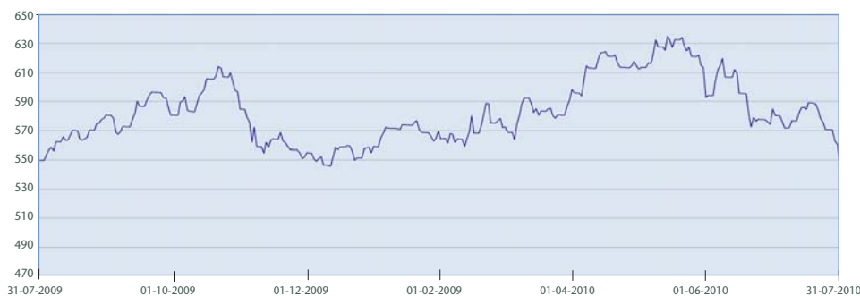
* Gráfico corresponde a Serie A